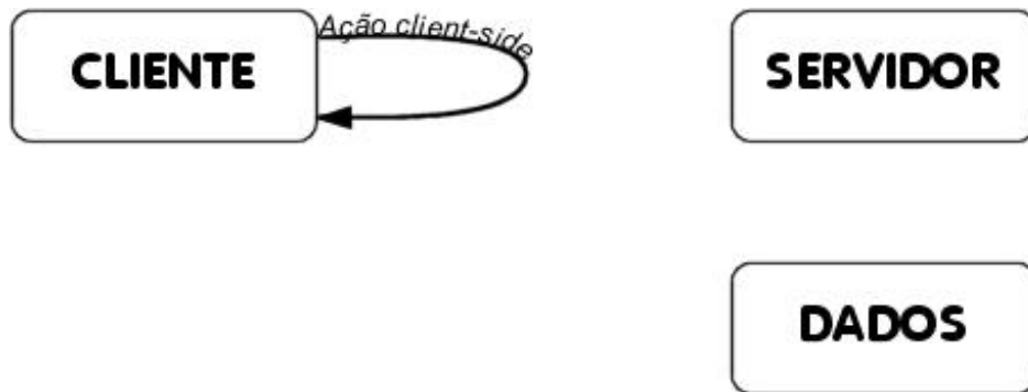
Figura 1. Funcionamento de scripts client-side

Os scripts client-side são muito úteis para fazer validações de formulários sem utilizar processamento do servidor e sem provocar tráfego na rede. Outra utilização comum é na construção de interfaces dinâmicas e “leves”.